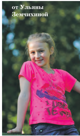
от Ульяны Земчихиной